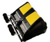
"Joy-stick" -karok a kézi működtetéshez.