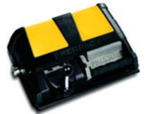
4/3 vezérlő szelep a kettős-működésű munkahengerekhez és szerszámokhoz.