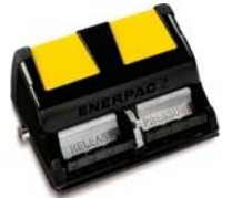
1 és 2 literes tartály kialakítás.